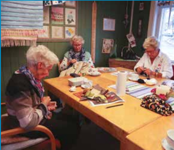
Flittige hender i arbeid på Seniorsenteret. Finn din julegave her!

Nå kan du starte julehandelen på Seniorsenteret i Niels Carlsens gate 20! I november og desember er det bare å stikke innom. Flittige fingre i arbeidsstua har stått på og sitter klare med masse flotte varer. Dørene er åpne fra 10.00 -14.00 mandag, tirsdag, onsdag og fredag.