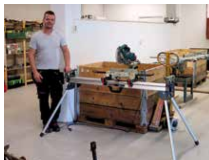
NAV ønsker velkommen til nye, supre lokaler midt i Storgata.

Andre frivillige som kaller seg «Men in action» tar med seg mannlige flyktninger på diverse aktiviteter - sist var det en tur til Håøya. Hver torsdag mellom kl. 12.00 og 14.00 er det norskundervisning for