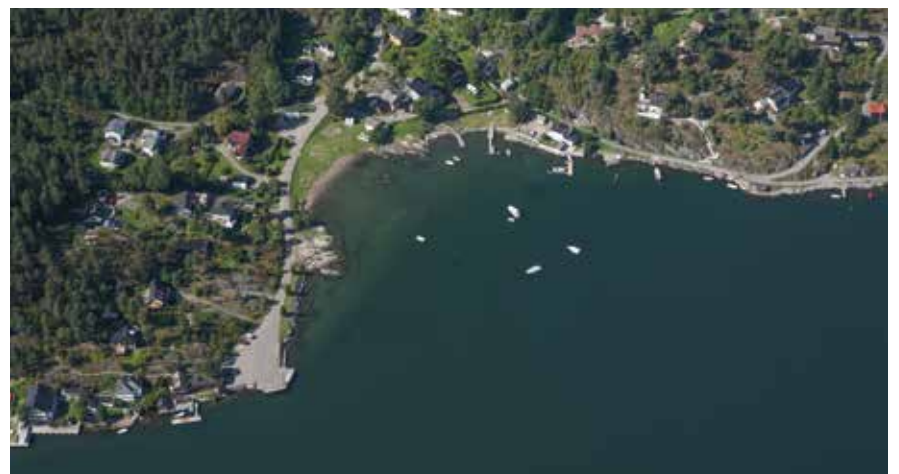
Brevik brygge blir ny!

munen vurdere muligheten til å rehabilitere betongmoloen ved Brevik. Kommunebrygga i Drøbak sentrum blir totalrehabilitert til ny trebrygge, og her ønsker vi at båter, tauverk osv. fjernes snarest mulig. I tillegg vil parkeringsplasser ved brygga bli sperret da entreprenøren skal ha brakker på parkeringsplassen. Det skal graves i veien for installasjon av en vannkum på brygga samt trekking av vannrør.