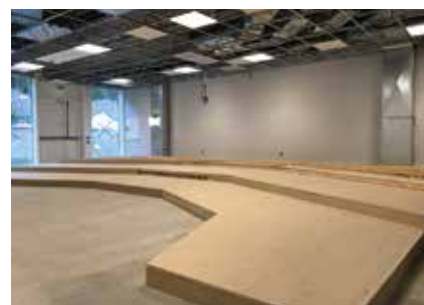
Spinningssalen bygges opp.