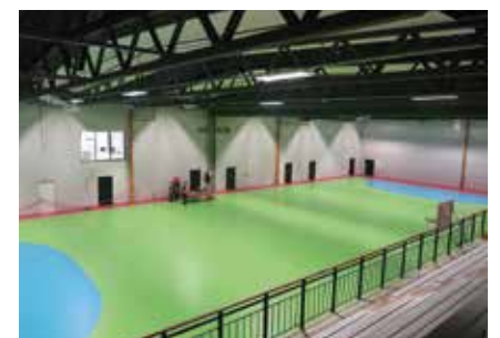
Nytt dekke og mer lys i Frognhallen.

For løpende informasjon og nyheter: Følg Frogn kommune på Facebook!