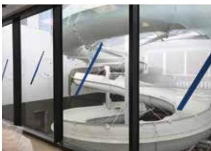
80 meter lang sklie – og mye moro!

For påmelding og mer info: Se mer om Bølgen og fullstendig prisliste for alle tilbudsvariantene av bad og trening på www.bolgenbad.no