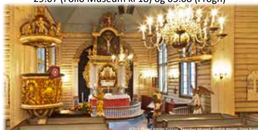
Grafisk design: Tone Bunnli

Alle søndager kl.11 unntatt: 29.07 (Follo Museum kl 18) og 05.08 (Frogn)