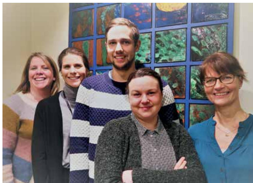
Denne blide gjengen ønsker nye medarbeidere velkommen til innsats på et spennende fagområde.

Med fem nyopprettede stillinger setter kommunen inn et ekstra gir i byggesaksarbeidet. De nye saksbehandlere skal styrke det allerede gode teamet som er på plass.