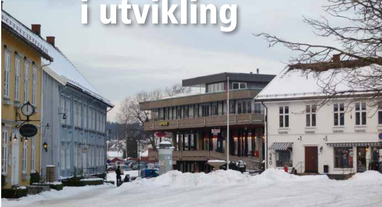
Tidligere utbygging viser hvor viktig det er å ha en plan for byutviklingen i verneverdige områder som Drøbak.

Frogn kommune er nå i gang med to store reguleringsplaner som gjelder Drøbak. Dette er planarbeider der vi må ha flere tanker i hodet samtidig. Derfor er det viktig for oss å høre hva du som bor her tenker.