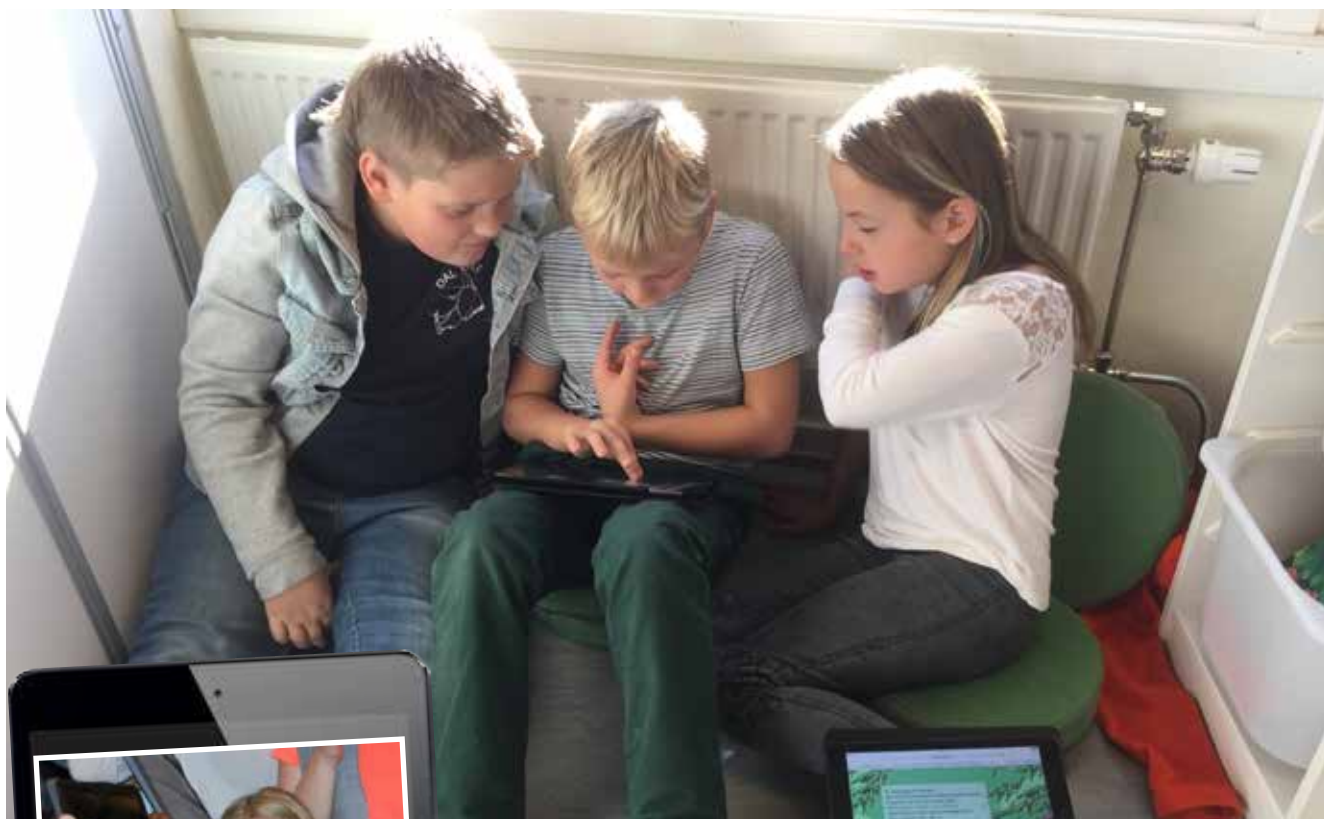
Et samarbeidsprosjekt på iPad i KRLE på 4. trinn endte opp som en tegnefilm. 7. trinnselever ved Dal samarbeider godt rundt brettene mens klasse 10 D ved Seiersten er 100 % fornøyde med sin nye digitale skoledag.

Mye morsommere å gjøre lekser! Enklere å holde orden! Lettere å lete opp ting! Tilbakemeldingene fra testpilotene i nettbrett-prosjektet ved Seiersten ungdomsskole og Dal skole er samstemte: iPad i undervisningen er bra.